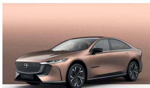
MELTING COPPER | €850 €714,29