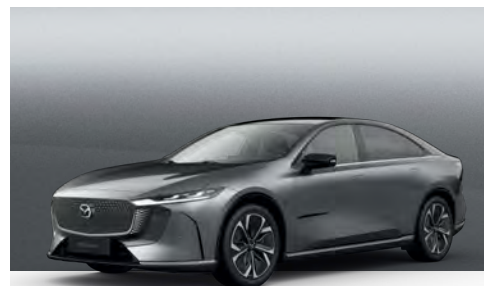
MACHINE GREY | €1.050 €882,35