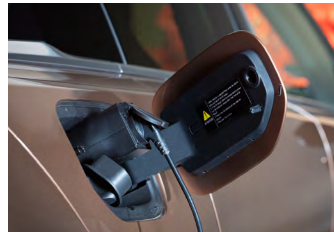
VEHICLE-TO-LOAD (V2L) ADAPTER