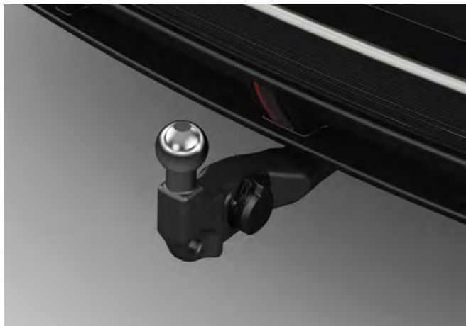
ANHÄNGEZUGVORRICHTUNG, ELEKTRISCH SCHWENKBAR