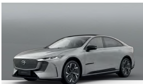
AERO GREY | €850 €714,29