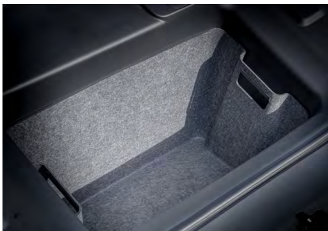
GEPÄCKKRAUMEINSATZ (FRUNK BOX)