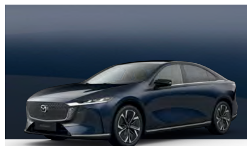
DEEP CRYSTAL BLUE | €850 €714,29