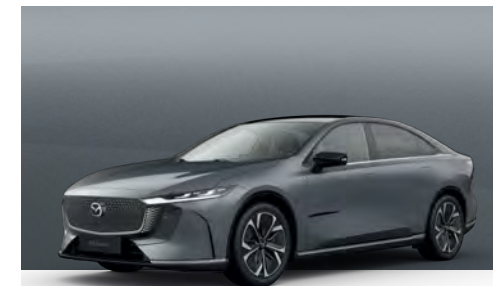
POLYMETAL GREY | €1.050 €882,35