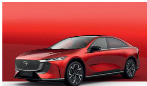
SOUL RED CRYSTAL | €1.200 €1.008,40