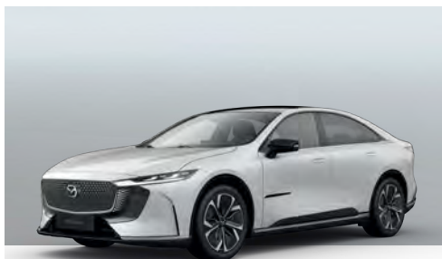
CRYSTAL WHITE PEARL | ohne Aufpreis