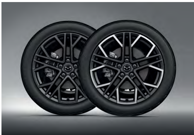
19-ZOLL-LEICHTMETALLFELGE, DESIGN 77, ANTHRAZIT GLÄNZEND / DESIGN 77A, DIAMANTSCHLIFF