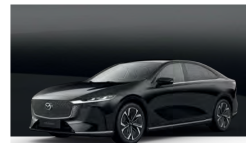
JET BLACK | €850 €714,29

Verwenden Sie unseren Konfigurator, um den Mazda6e zu finden, der perfekt zu Ihnen passt.