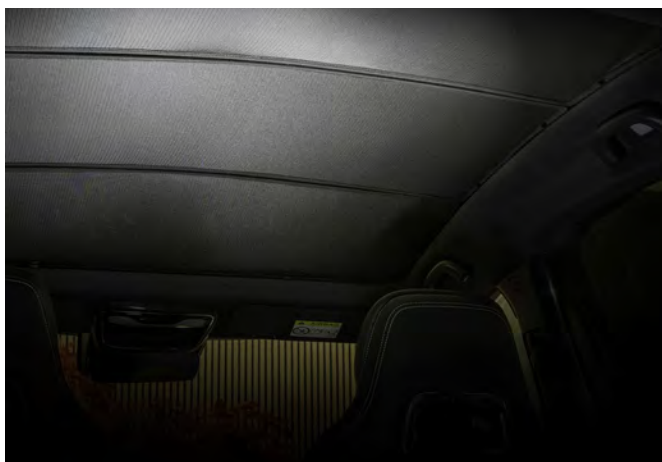
SONNENBLENDE FÜR PANORAMA-GLASDACH (NUR TAKUMI)