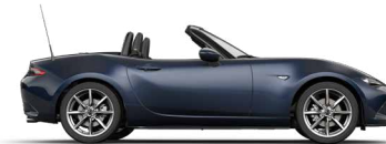
DEEP CRYSTAL BLUE (42M) 1)