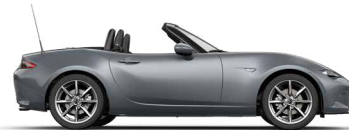
POLYMETAL GREY (47C) 2)