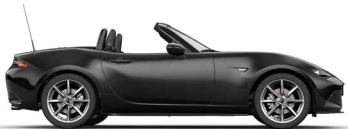
JET BLACK (41W) 1)