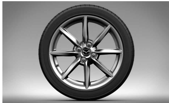
17-Zoll-Leichtmetallfelgen in Bright Dark