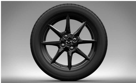
16-Zoll-Leichtmetallfelgen in Schwarz