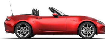
SOUL RED CRYSTAL (46V) 2)

* Sitzmittelbahn und -wangen in Leder 1) Metallic-Lackierung 2) Sonderfarbe