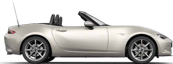
PLATINUM QUARTZ (47S) 1)