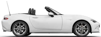
ARCTIC WHITE (A4D)