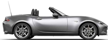
MACHINE GREY (46G) 2)